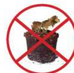
Mottes de terre