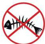
Poisson et restes de fruits de mer