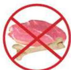
Os et restes de viandes