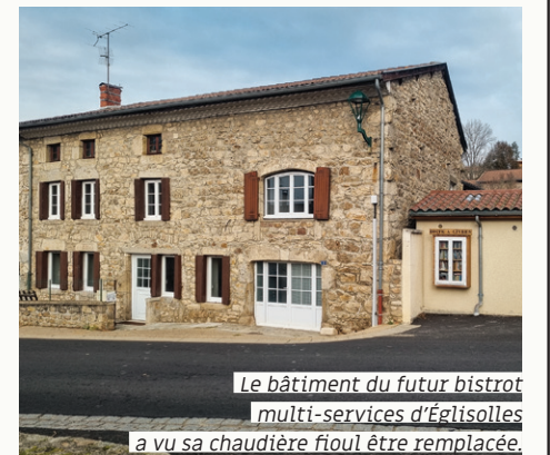
Le bâtiment du futur bistrot multi-services d'Églisolles a vu sa chaudière fioul être remplacée.

La Commune a fait évoluer le système de chauffage du bâtiment de son futur bistrot communal , afin d'améliorer le confort et réduire les coûts, tout en participant à l'économie locale de la filière bois énergie. Églisolles a bénéficié du dispositif Chaleur Livradois Forez. Il comprend l'accompagnement administratif de la Communauté de communes et technique de l'Aduhme. Son objectif est de faciliter le recours aux énergies renouvelables pour couvrir les besoins de chauffage et d'eau chaude sanitaire des communes du territoire. Si ce dispositif est aujourd'hui terminé, des aides sont toujours mobilisables. Le montant de cette opération s'élève à 41.294,96€ TTC, financée à hauteur de 38% avec l'aide de l'ADEME (11.711€) et du Département (4.182€). La mise en service a été effectuée en décembre 2024. La réduction des émissions de CO2 est estimée à 5 tonnes par an.